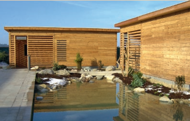
Modern, individuell, massiv: Saunanlage in Passau