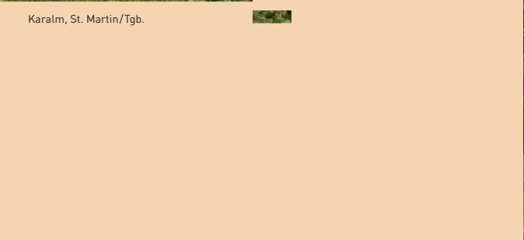
Karalm, St. Martin/Tgb.