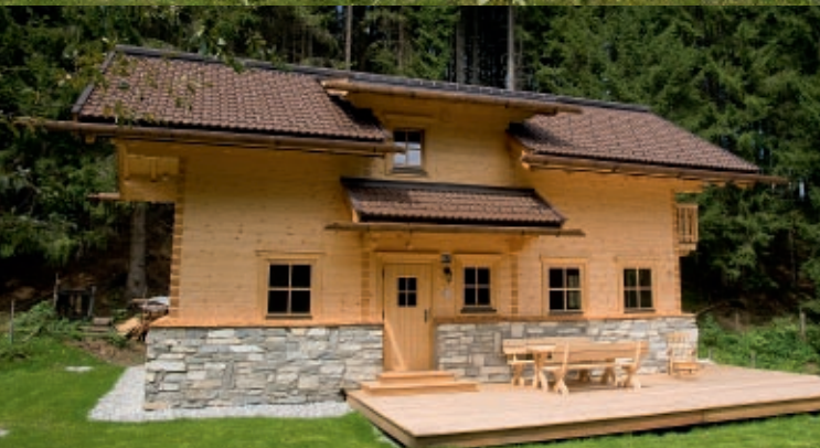
Massiver Blockbau Privathaus Flachau Planung: Pongauer Holzbau