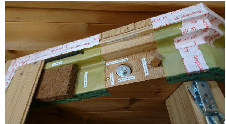
DB 90-Dampfbremse verklebt

Diese Zeichnung ist unser geistiges Eigentum. Die Verwendung unserer Ausführung bzw. unserer Ideen bedarf unserer schriftlichen Zustimmung. Jede unbefugte Verwendung ist strafbar und verpflichtet zu Schadenersatz.